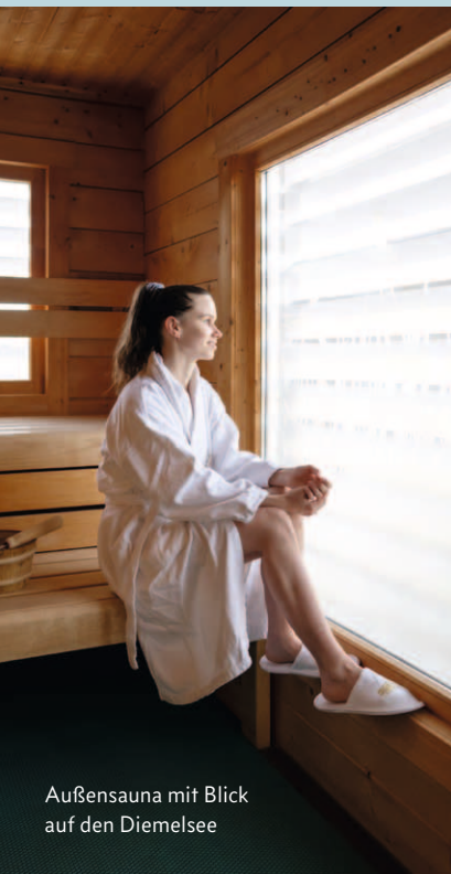
Außensauna mit Blick auf den Diemelsee